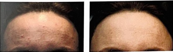
Huidverbetering en gladstrijken fijne lijntjes na 2 behandelingen